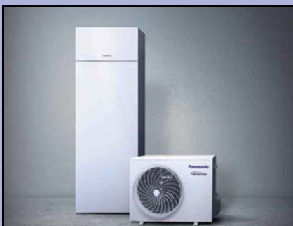
WARMTEPOMP LUCHT / WATER