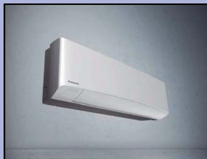
RESIDENTIËLE AIR CONDITIONING