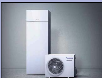
POMPE À CHALEUR AIR/EAU